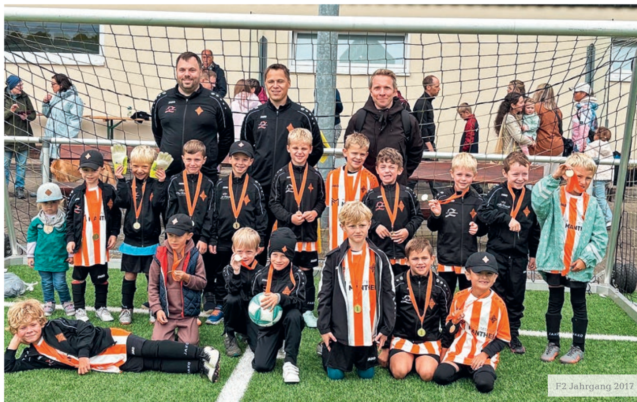
F2 Jahrgang 2017