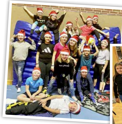
Ein verrückter Haufen: Unsere E-Mädels bei ihrer kleinen Weihnachtsfeier.