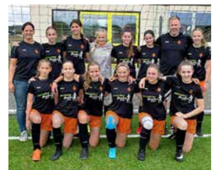
Starke Truppe: Unsere C-Juniorinnen haben in der Saison 22/23 bislang alle acht Meisterschaftsspiele gewonnen.