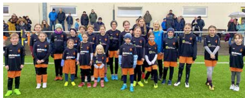
Der Fußball beim JFV FC Eifel ist weiblich: Rund ein Viertel der 400 Aktiven des Jugendfördervereins sind Mädels. Hier die F-, E- und D-Juniorinnen bei der Einlaufaktion im November.