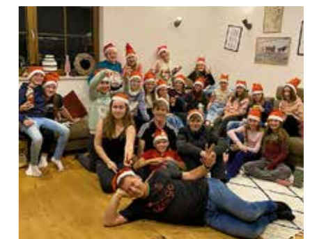
Unsere D-Juniorinnen sind in kürzester Zeit zu einer verschworenen Einheit zusammengewachsen.