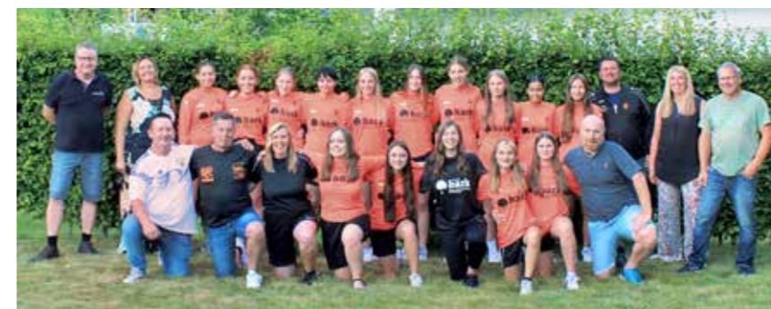
Für den Meistertitel der B-Juniorinnen im Bezirk Aachen-Düren-Heinsberg gab es für unsere U17 neben einer Meisterschale und einer fetten Meisterparty auch kleine Andenken.